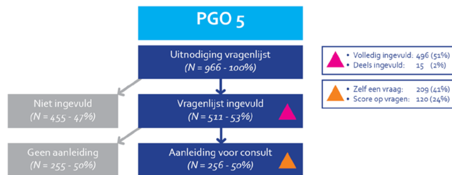
Figuur 1. Bereik en signalering PGO 5

De Jij en Je Gezondheid (JEJG) vragenlijst gaf bij 256 ouders van 5-jarigen (50%) aanleiding tot een gesprek.